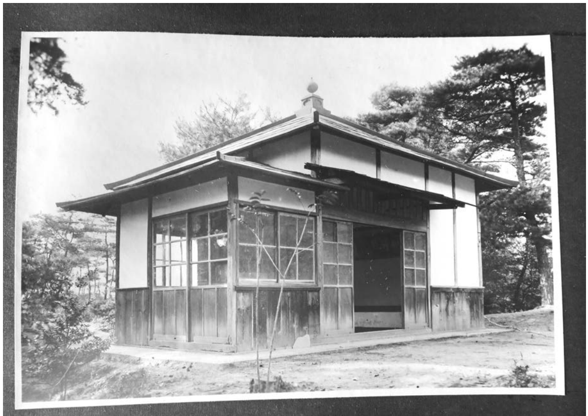
写真7) 如神殿写真

建築的には、屋根が宝珠を伴う宝形造の典型である点が、鍛錬所としては珍しい (11) 。これが舞子時代からなのか、圓福寺移築時に改築があつたのかは不明であるが、諸書を見る限り圓福寺移築に際しての改築の記載はな