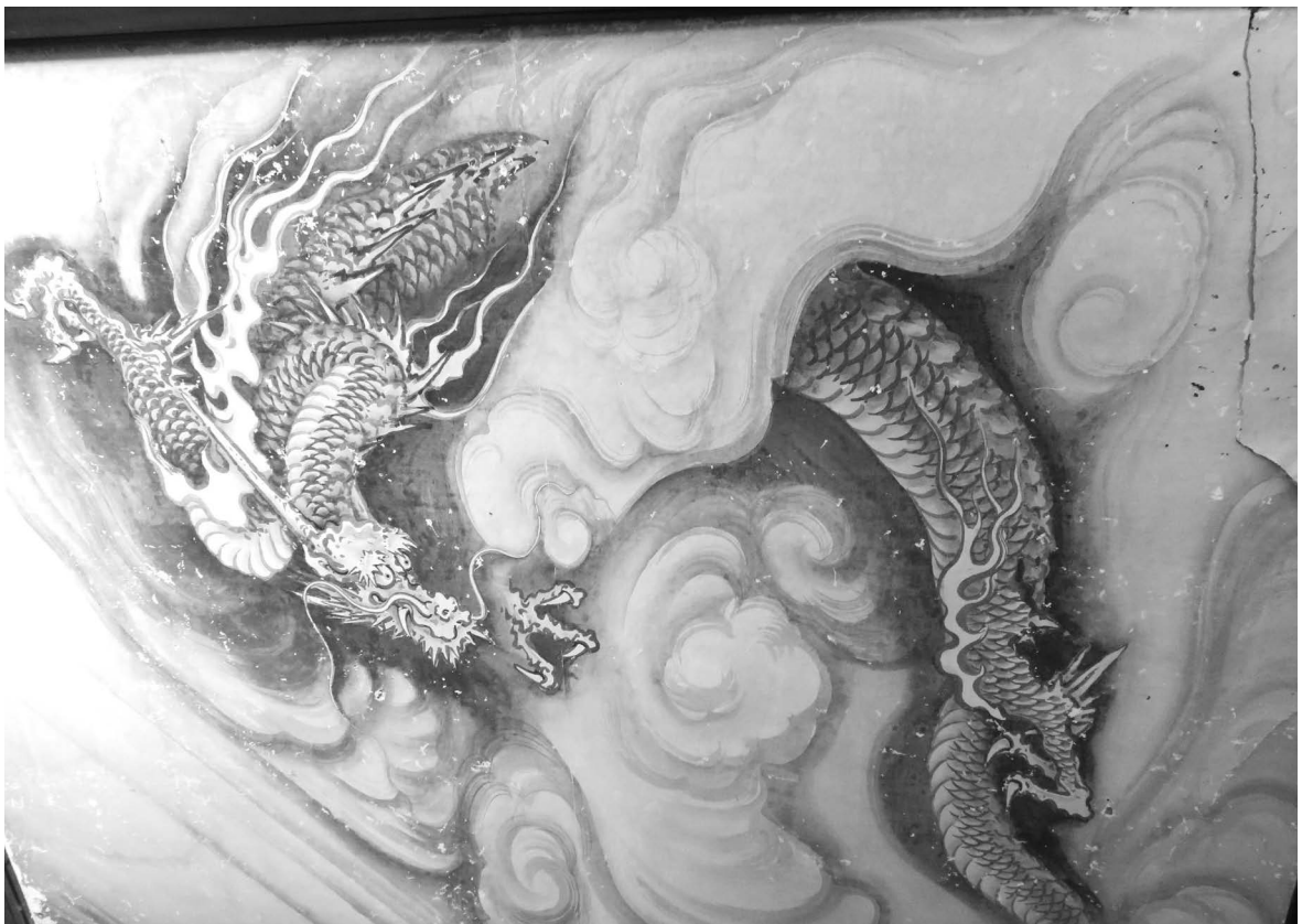
写真5) 雲龍図壁画 田中良雄画