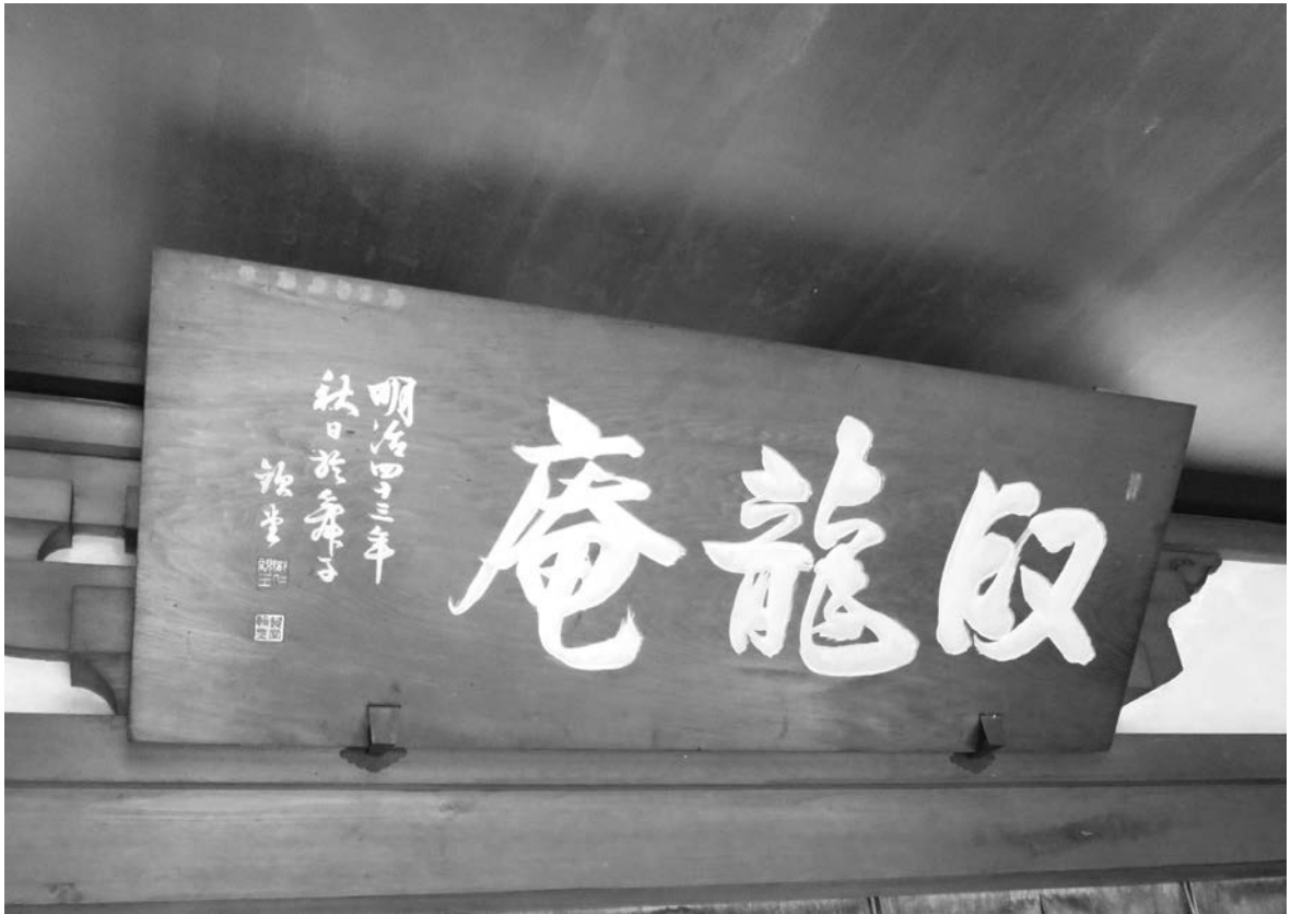
写真4) 臥龍庵看板 圓福寺所蔵