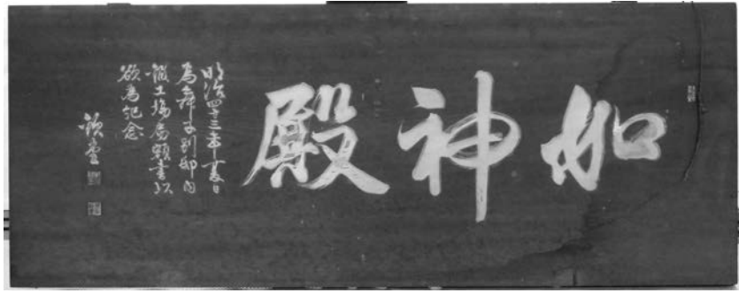
写真2) 如神殿看板 圓福寺所蔵

い、参考の為にいちいち書き留めて置き、又帰った上で話して聞かせよと、 毎々御沙汰がありました。『威仁親王行実』による。旧字・仮名遣いのみ 改めた)