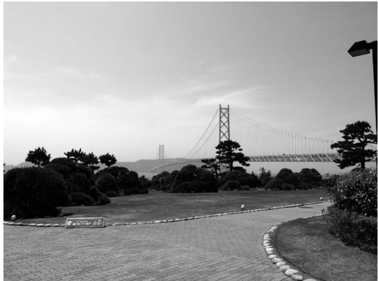
写真1) シーサイドホテル舞子ビラ神戸 ガーデンテラス風景

明治二十一年に購入してから三十年足らずではあったが、風光明媚なこの地を二人の親王はこよなく愛していた。しかし、この地に威仁親王がひ