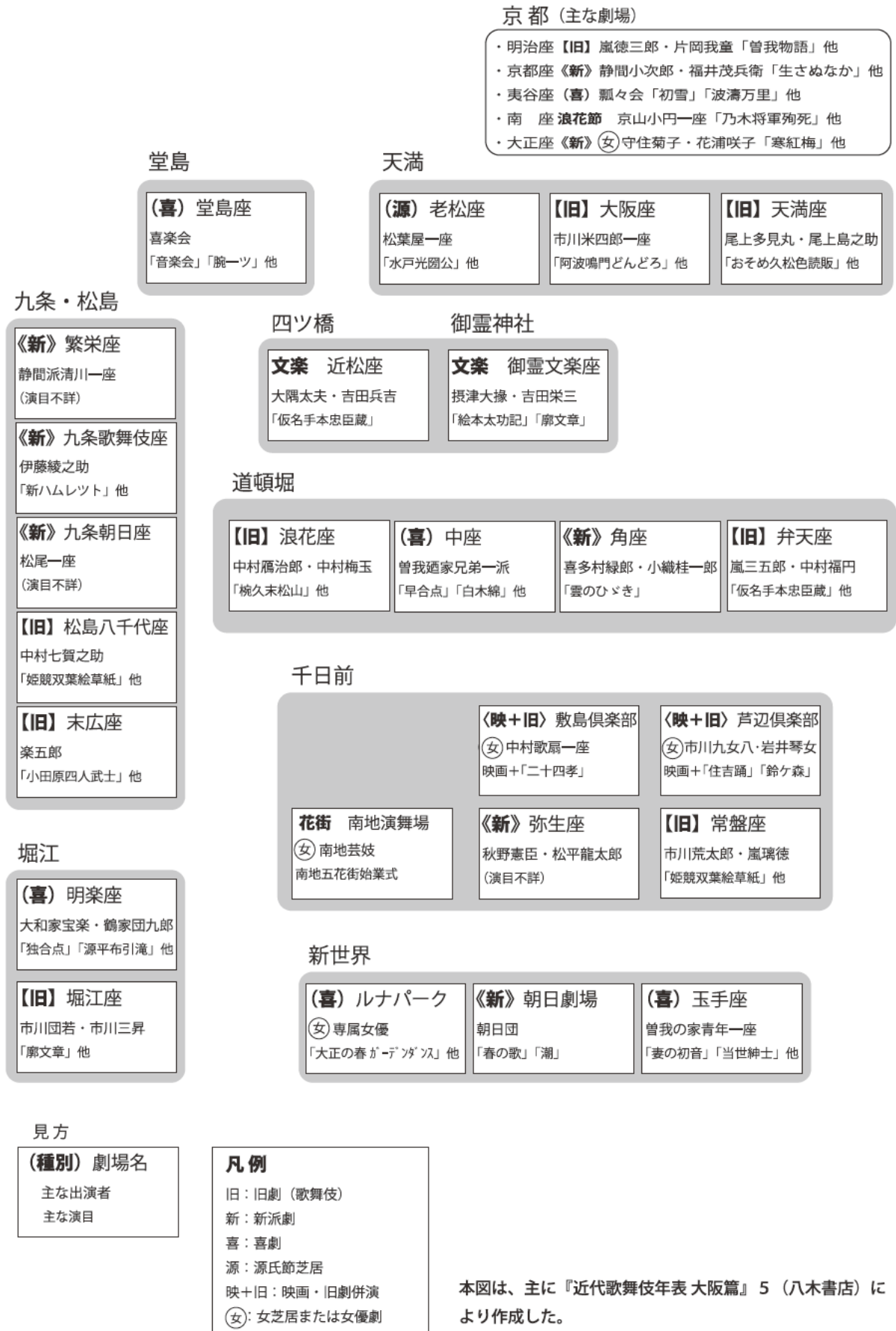
図 大正2年(1913)1月上旬 大阪市内 常設劇場の興行(活動写真館・寄席は含まない)