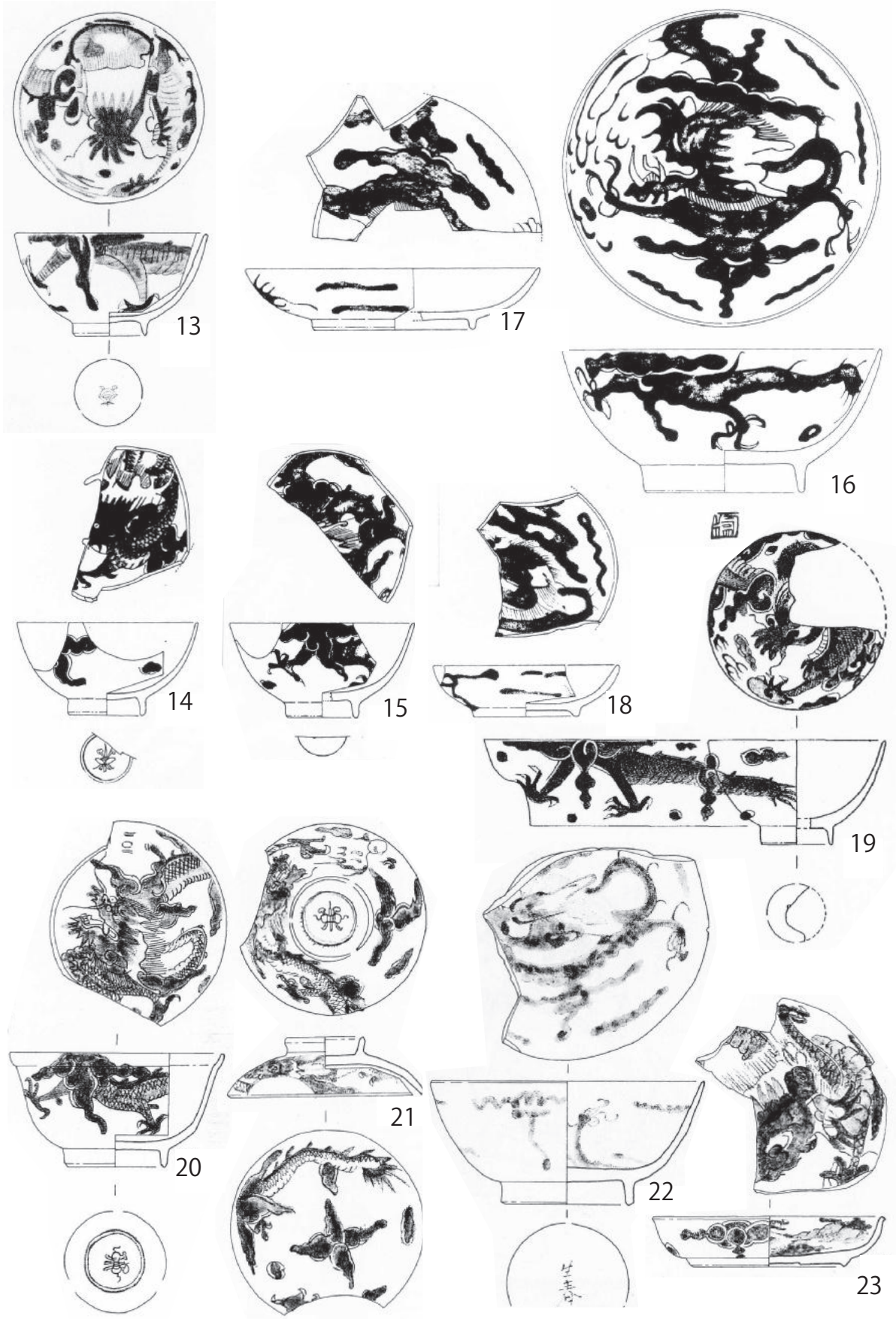
図2. 過牆龍文磁器 (S=1:3) 13: 岩原目付屋敷跡、14~18: 唐人屋敷跡、19~23: 万才町遺跡