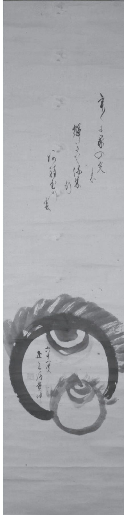
図1 「宝珠図 慈光寺実仲筆」全図