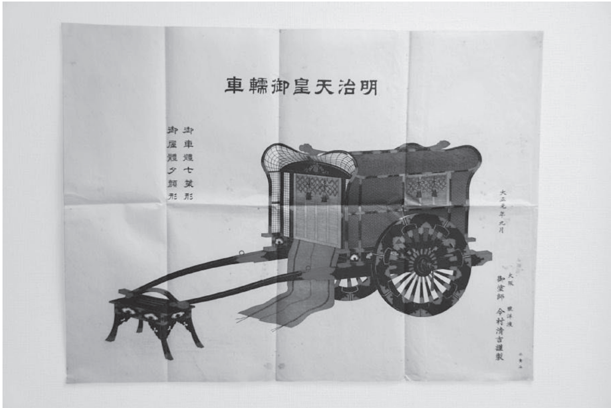
図1 明治天皇御輦車図 (個人蔵)