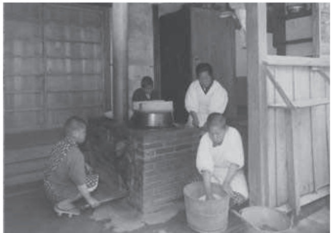
図6 修徳館での炊事 1929年

修徳館の他に自炊制度を採用した感化院としては、管見のかぎり「悉く生徒の手でやらした」私立山梨農芸苑 37 や、「子供全体がやる」埼玉県立埼玉学園 38 、さらには「炊事ノ一部ハ生徒ニ手伝」わせた秋田県立陶育院 39 があるぐらいで、炊婦（夫）を雇う感化院が一般的であったと考えられる 40 。