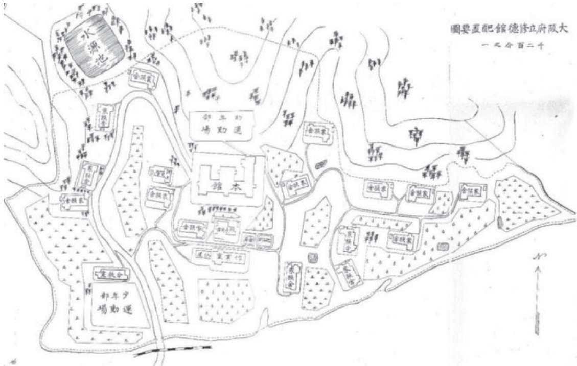
図3 大阪府立修徳館配置要図 1923年 (大阪府立中央図書館蔵)

子供が通学するように、館生が「家庭」から本館へ「通学」するように設計されていたことがわかる。