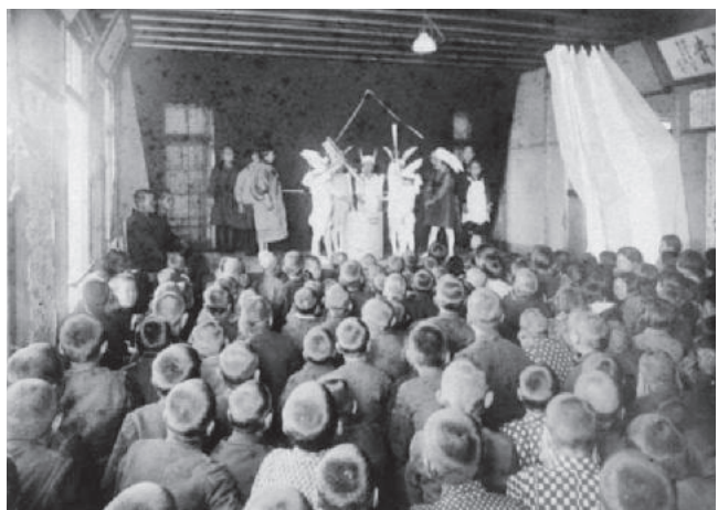
図8 武田塾子供の会 1932年（社会福祉法人武田塾蔵）

武田塾では、1927年に地元の堅下村の学齢児童を対象とする「子供の会」が組織され、同年6月19日から毎月1回娯楽会を開催するという事業が始まっている。大阪府知事による塾設立認可（同年5月18日）から1ヶ月後のことである。当初、この子供の会は、塾の事業とは「別個ノ立場ニ於テ試験的ニ」実施されたものであったが、1932年4月10日の会（第53回）から塾の事業に移管された。図8は、この第53回を撮影したものである。この時は、180名の子供が参加し、塾生と子供会員合同で童話劇が行われた。塾の講堂は「立錫の余地もなき」状況であったという 44 。