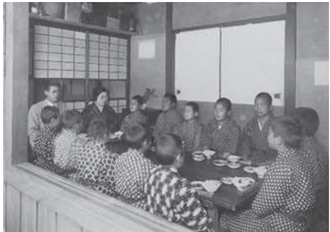
図5 修徳館での食事 1929年

修徳館では、1917年6月1日から家庭ごとのかまどで保母の指導を受けた生徒たちが共同で炊事をするようになった。それまでは、女子家庭のみ自炊を行い、男子家庭は「特別炊事人」（職員）が食事をつくっていた。このような制度が採用されたのは、食事に対する在館生からの苦情を減らす目的からであったという。実施に先立ち、その可否を全生徒に質したところ、「是非やって欲しい」ということになり、実施されたという。食事の内容は「飯は麦四、米六の割合にて、又菜は本館農園に産するものを主」とするもので、「各児孰れも興味と満足を以て」自炊に取り組んだという 36 。図6は、柏原移転後に撮影されたものである。割烹着を着て、包丁を使う女性が保母であろう。男子三名が炊事に協力している場面を撮影したものである。