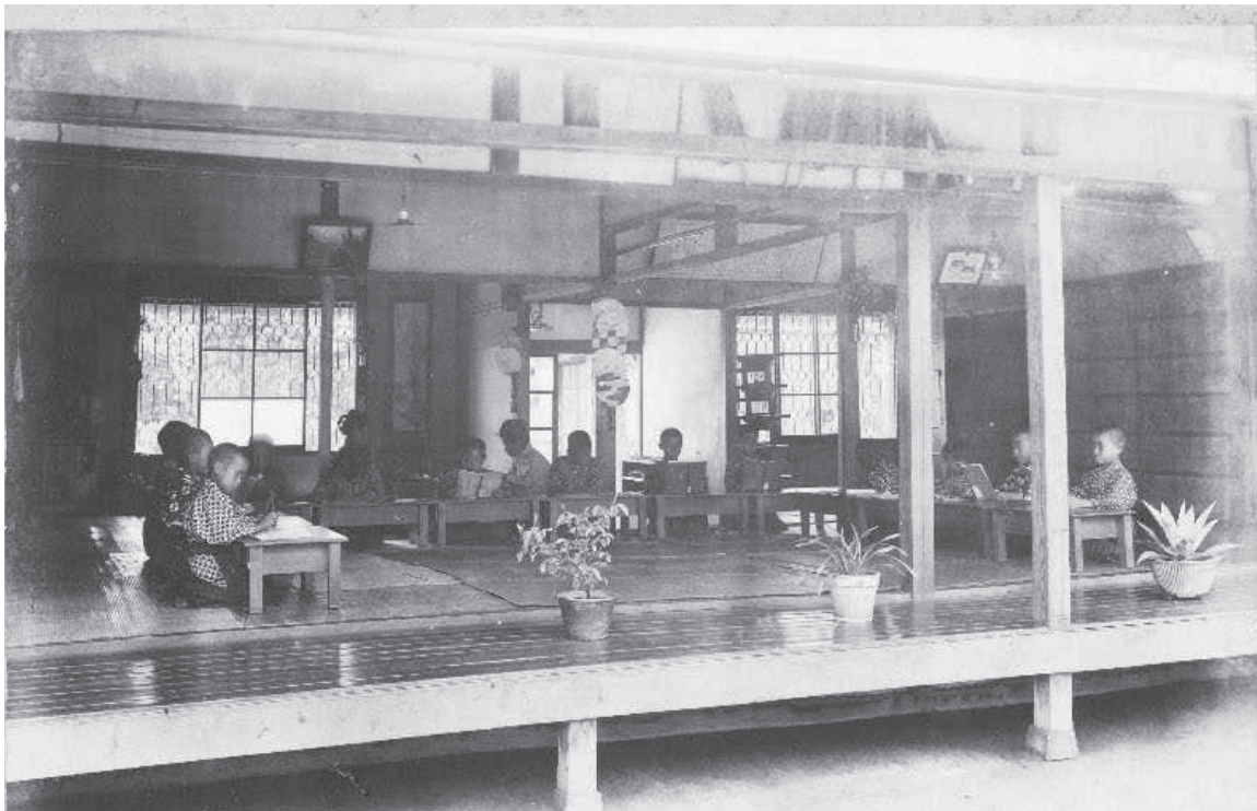
図4 修徳館幼年部家庭 1922年

また、各家庭には保母（「お母さん」）1名が配置され、館生と「寝食を共に」した。図4は、1922年時点のもので、幼年部の家族舎を撮影したものである。コの字型に机が並び、13名の館生が座って勉強している。その奥の中央部に2人の女性が座っている。どちらかが保母であろう。