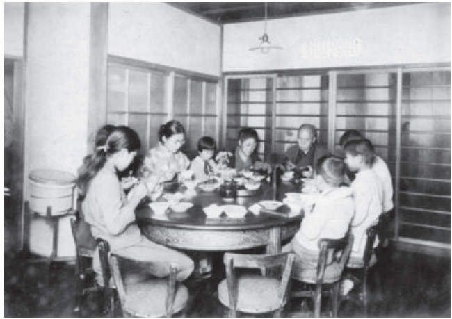
図7 武田塾食事室 1927年

武田は、館長退職を見据えて1926年に私費でより小規模な感化矯正施設として武田塾（現社会福祉法人武田塾）を修徳館近くに創設し、1927年の館長退職後は塾長として運営に専念した 43 。武田塾でも家族制度が採用されたが、早期矯正に効果があるとの武田の信念から、入塾児童を12歳以下に限定した。収容児童数は12名以下と小規模であった。そのため、修徳館では職員夫婦が在館生の両親役を担っていたが、武田塾では武田慎治郎・ヒサ夫妻が