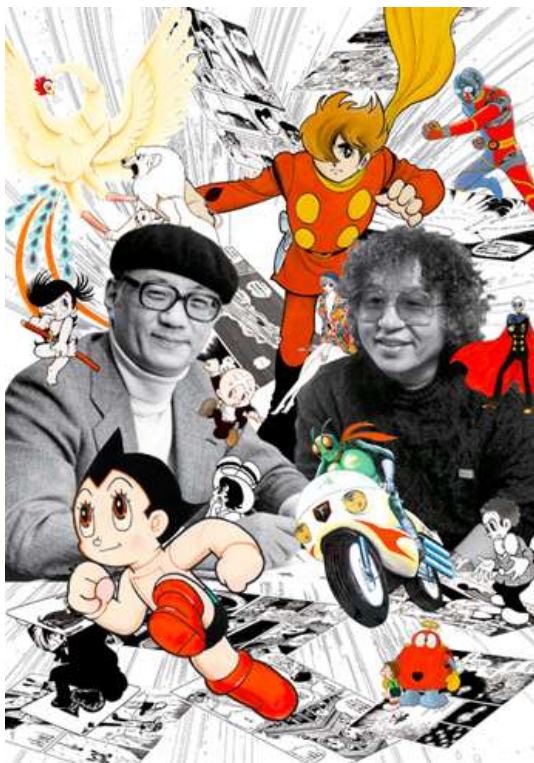
広報用画像①