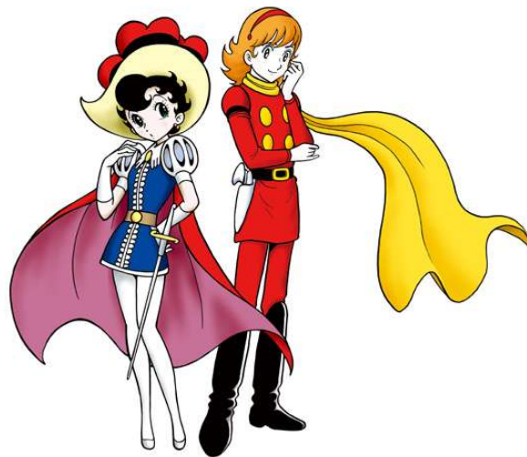
②サファイア×フランソワーズ(003) ©手塚プロダクション ©石森プロ