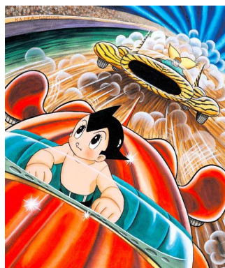
⑤手塚治虫 《鉄腕アトム》 ©手塚プロダクション