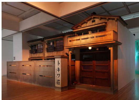
④トキワ荘(復元展示)