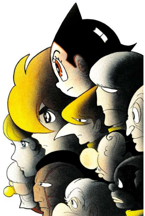
広報用画像② ©手塚プロダクション ©石森プロ