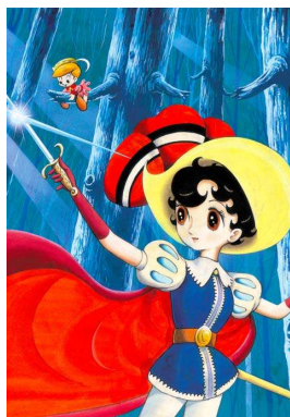
⑦手塚治虫 《リボンの騎士》 ©手塚プロダクション