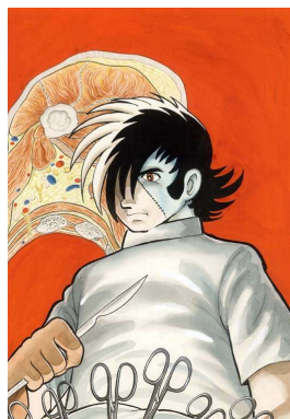
⑨手塚治虫 《ブラック・ジャック》 ©手塚プロダクション