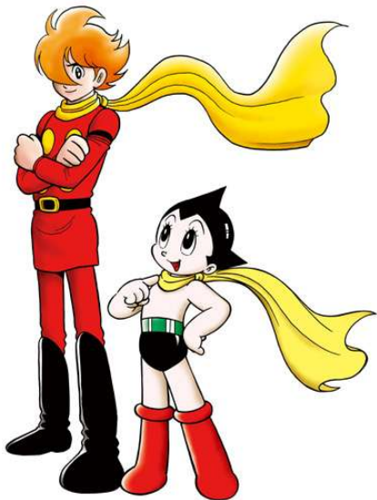
①アトム&島村ジョー(009) ©手塚プロダクション ©石森プロ