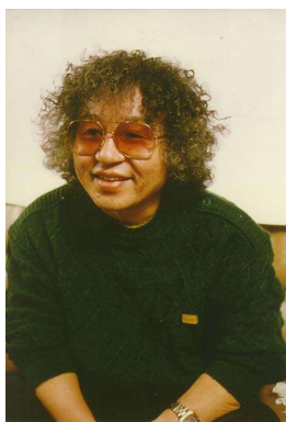
④石/森章太郎 ©石森プロ