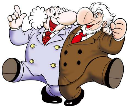
③お茶の水博士×ギルモア博士 ©手塚プロダクション ©石森プロ