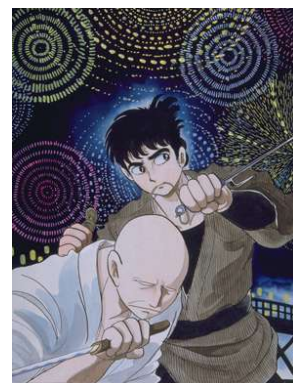
⑩石/森章太郎 《佐武と市捕物控》 ©石森プロ