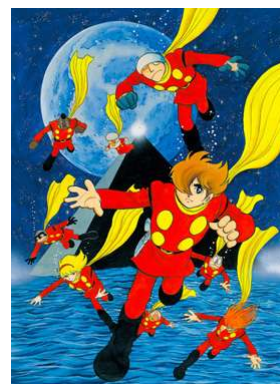
⑥石/森章太郎 《サイボーグ 009》 ©石森プロ