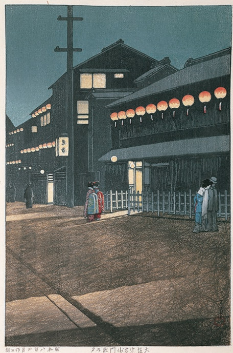
《大坂宗右衛門町の夕》 日本風景集II 関西篇 1933(昭和8)年4月

1933(昭和8)年、巴水は伊勢から奈良、紀州、京都、大阪を巡る2週間余りの旅をします。これらの旅の収穫をまとめて版行された『日本風景集II 関西篇』には大阪の風景も含まれています。