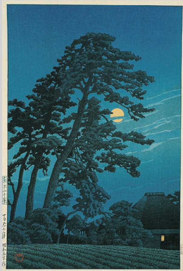
まごめ 《馬込の月》 東京二十景 1930(昭和5)年

1933(昭和8)年、巴水は伊勢から奈良、紀州、京都、大阪を巡る2週間余りの旅をします。これらの旅の収穫をまとめて版行された『日本風景集II 関西篇』には大阪の風景も含まれています。