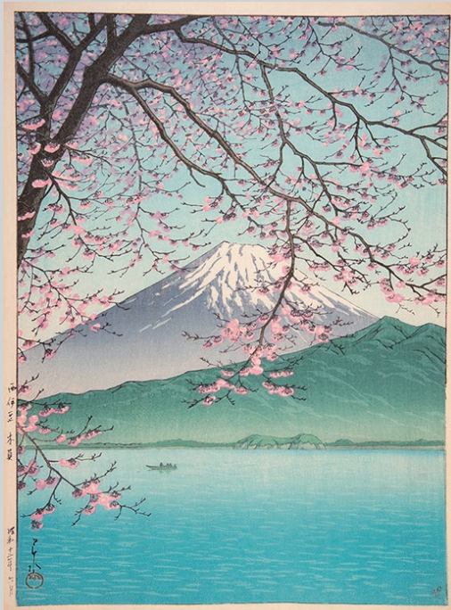
きしゅう 《西伊豆木負》 1937(昭和12)年6月 版元・渡邊木版美術画舗蔵